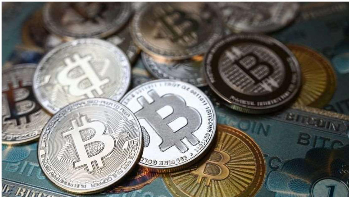
香港虛擬資產行業的監管等制度需要逐步加強完善才能增加競爭力。